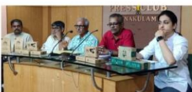
സംസ്ഥാനതലത്തിൽ നടന്നുവരുന്ന ഈ മേഖലയിലെ ഹോട്ടൽടെക് കേരള പ്രവർത്തനം സംഘാടകർ വാർത്താസമ്മേളനത്തിൽ അറിയിച്ചു. ഹോട്ടൽടെക് കേരള പ്രവർത്തനം ജൂൺ 7, 8, 9 തീയതികളിൽ നടക്കുമെന്ന് സംഘാടകർ വാർത്താസമ്മേളനത്തിൽ അറിയിച്ചു.

കൊച്ചി: സംസ്ഥാനത്തെ ആതിഥേയ വ്യവസായ മേഖലയിലെ ഹോട്ടൽടെക് കേരള പ്രവർത്തനം ജൂൺ 7, 8, 9 തീയതികളിൽ നടക്കുമെന്ന് സംഘാടകർ വാർത്താസമ്മേളനത്തിൽ അറിയിച്ചു. ഹോട്ടൽടെക് കേരള പ്രവർത്തനം സംഘാടകർ വാർത്താസമ്മേളനത്തിൽ അറിയിച്ചു. ഹോട്ടൽടെക് കേരള പ്രവർത്തനം ജൂൺ 7, 8, 9 തീയതികളിൽ നടക്കുമെന്ന് സംഘാടകർ വാർത്താസമ്മേളനത്തിൽ അറിയിച്ചു. ഹോട്ടൽടെക് കേരള പ്രവർത്തനം ജൂൺ 7, 8, 9 തീയതികളിൽ നടക്കുമെന്ന് സംഘാടകർ വാർത്താസമ്മേളനത്തിൽ അറിയിച്ചു.