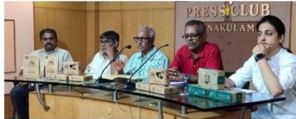
8-June-2023 - By: Business Desk